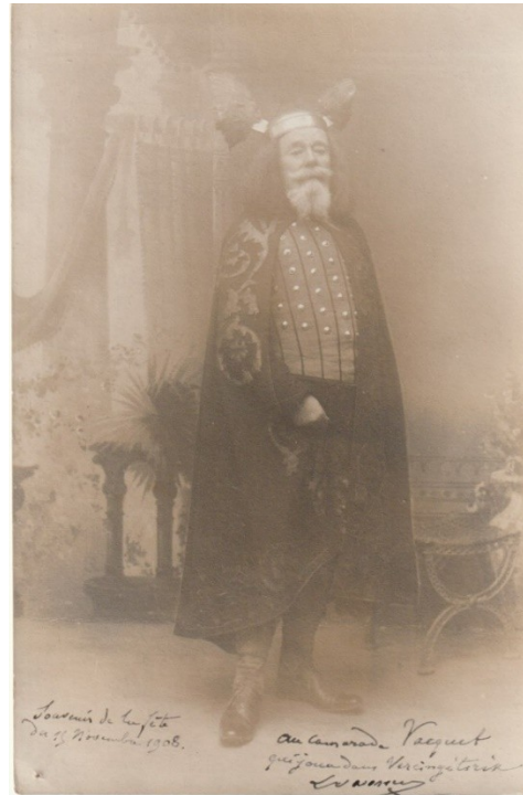
Pièce de théâtre à St Marceau